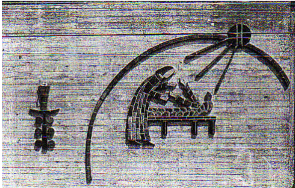
„Kunst am Bau“ im alten Krankenhaus

Im Juni 1903 war der Bau (in der Gartenstraße (7*)) vollendet und die Berner Schwestern konnten einziehen. Unter ihnen befand sich auch eine Schwester, die schon früher in Selters gewesen war.