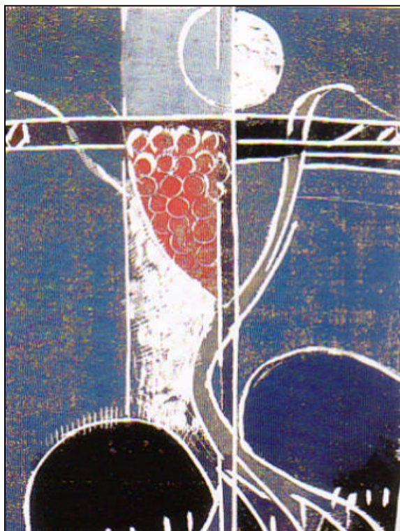
Holzchnitt von Andress Felger „Ich bin der Weinstock“ in der Krankenhaus-Kapelle in Selters

Und in der Folgezeit entstand aus der Schwesternstation das Selterser Krankenhaus und der Selterser Hilfsverein als Träger der Einrichtung.